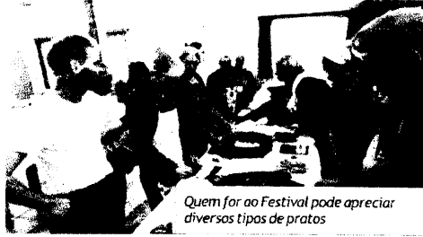
Quem for ao Festival pode apreciar diversos tipos de pratos